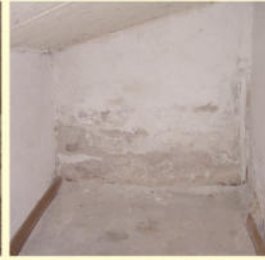
Feuchtigkeitsanierung mit Verputzarbeiten